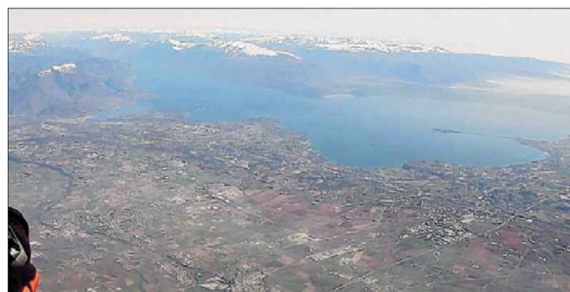
Vorn der Gardasee, hinten verschneite Alpengipfel. Die Ballone des Haller Teams landen unweit von Brescia.